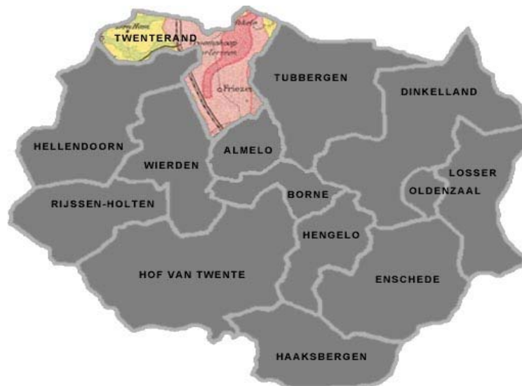
Fig. 2: Gemeente Twenterand

De gemeente Twenterand is een moderne plattelandsgemeente die aan de noordwest-rand van Twente ligt. Het grenst aan de gemeenten Almelo, Hardenberg, Hellendoorn, Wierden, Ommen en Tubbergen en heeft een oppervlakte van 108,07 km 2 . De gemeente Twenterand telt negen woonkernen en buurtschappen: Bruinehaar, De Pollen, Den Ham, Geerdijk, Vriezenveen, Vroomshoop, Weitemanslanden, Westerhoeven en Westerhaar-Vriezenveensewijk. Gemeente Twenterand heeft bijna 34.000 inwoners.