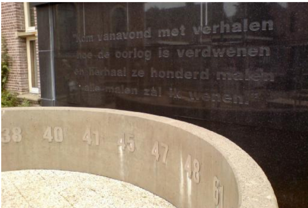
Afbeelding 1 Bevrijdingsmonument in Denekamp (Ars, 2007)

De gemeente Dinkelland is gelegen in de provincie Overijssel. Ze is in 2001 ontstaan als gevolg van de samenvoeging van de gemeenten Ootmarsum, Denekamp en Weerselo en telt ruim 26.000 inwoners op een oppervlakte van 184 km 2 . (Staatsalmanak, 2006)