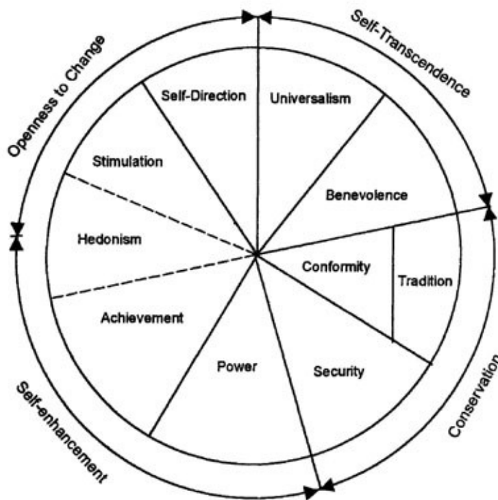
Figuur 1. Theoretisch model van motivational types of values en de relaties ertussen (Schwartz, 1994)

Met deze domeinen is Schwartz in staat waardeprioriteiten van groepen met elkaar te vergelijken. Door te kijken in welk domein de meest belangrijke waarden van een groep zich bevinden zijn deze groepen met elkaar te vergelijken.