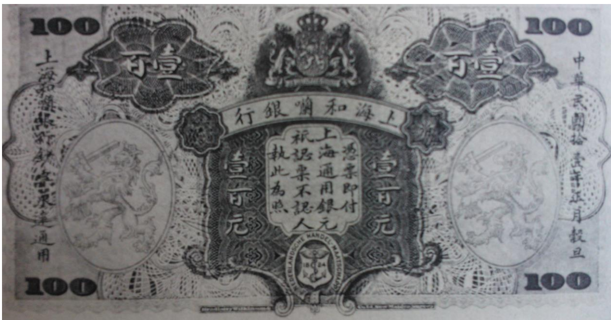
Afbeelding III: 100 Shanghai dollar uitgegeven door de Nederlandsche Handels Maatschappij

hadden geen waarde in China en Chinese valuta geen waarde in Europa. De Shanghai dollar was een wisselmunt die de verschillende valuta linkte om op een makkelijker manier handel te drijven. In 1903 begon zij met de uitgifte van de Shanghai dollar die tot 1946 in circulatie zou blijven. De Nederlandsche Handels Maatschappij deed dit omdat er geen centrale bank was in China. Naast de Nederlandsche Handels Maatschappij waren er verschillende Europese banken die dit ook deden (Sandrock 2013) 17 , onder andere de Banque Sino-Belge (België), Deutsche-Asiatische Bank (Duitsland), International Banking Corporation (Verenigde Staten), Banque de l'Indochine (Frankrijk) en de Russo-Asiatic Bank (Rusland). De Nederlandsche Handels Maatschappij was relatief klein in vergelijking met de andere banken maar nam wel een prominente rol in als opleidingsinstituut voor Chinese bankiers. Ook het aantal dollars dat in circulatie was bleef laag, dit kwam omdat de Nederlandse wet veel reserves voorschreef voor de uitgifte van coupures.