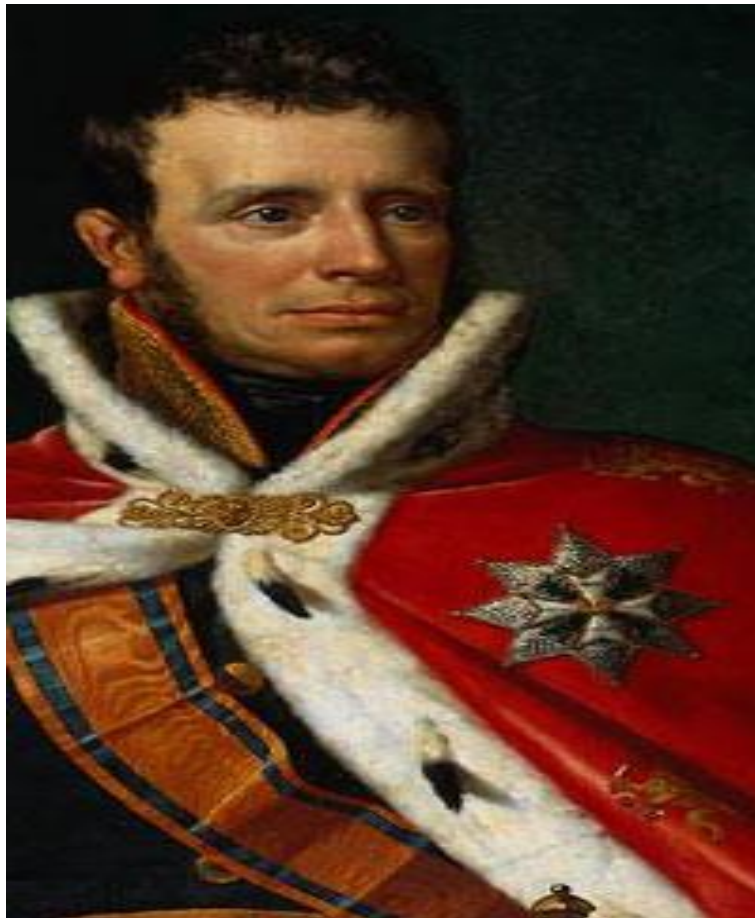
Afbeelding 1: Koning Willem I, initiatiefnemer van de Nederlandsche Handels Maatschappij

bedrijven. Grote multinationals zoals de Nederlandsche Handels Maatschappij zijn de drijvende kracht achter een verder mondialiserende wereld. Deze mondialisering veroorzaakt verdere integratie tussen de verschillende economische- en handelssystemen over de hele wereld. Dit onderzoek naar de mondialisering van de Maatschappij zelf past heel goed tussen de verschillende bedrijfshistoriën en de impact die zij hebben gehad in het macro-economische geheel in de 19 e en 20 e eeuw.