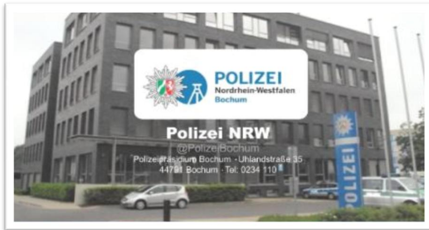
Afbeelding 2: Screen shot van het Twitter profiel van de politiestation Polizei NRW